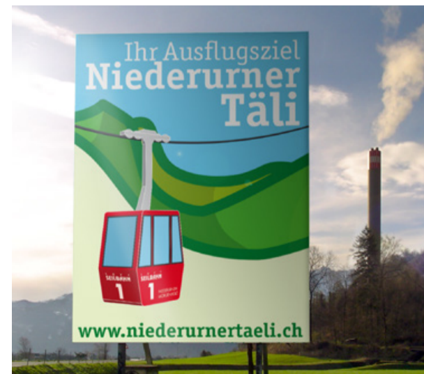
Reklame für eine Luftseilbahn in Niederurnen GL. (Gestaltung: Leuzinger & Benz AG)