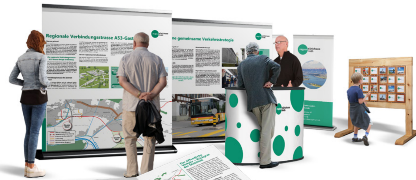
Authentischer Auftritt für einen Gemeindeverbund. (Konzept, Inhalt, Grafik-Design: Leuzinger & Benz AG)

Nichtsdestotrotz ist es der Region ZürichseeLinth wichtig, die Bevölkerung über ihre Arbeit zu informieren. Zahlreiche Verkehrs- und Raumplanungsprojekte setzen den Einbezug der Stimmbürgerschaft voraus – und damit ein grundlegendes Verständnis der Bevölkerung für die anspruchsvolle Materie.