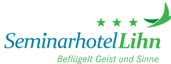
Vom Ferienhaus zum Seminarhotel: Leuzinger & Benz hat das Haus neu positioniert und ein Erscheinungsbild entwickelt, das die Magie des Ortes und den Spirit des Hauses sichtbar macht.

einem Klick Farben und Grössenverhältnisse verändern und neue Schriften ausprobieren. Alle diese Möglichkeiten nützen dem Gestalter aber nur, wenn er sein Handwerk von Grund auf beherrscht und er sich ob der vielen Möglichkeiten nicht in die Irre führen lässt. Unverzichtbar bleibt in jedem Fall eine vertiefte Auseinandersetzung mit der Unternehmung oder dem zu begleitenden Projekt. Ein präzises Agenturbriefing ist dafür zentral.