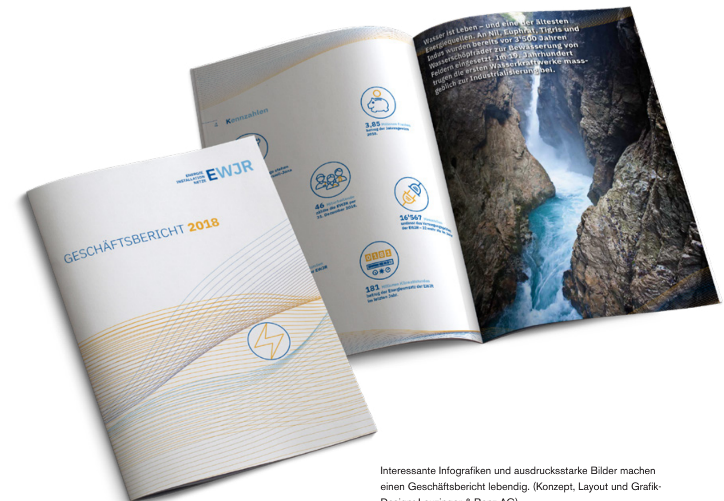
Interessante Infografiken und ausdrucksstarke Bilder machen einen Geschäftsbericht lebendig. (Konzept, Layout und Grafik-Design: Leuzinger & Benz AG)

§ Juristische Personen sind von Gesetzes wegen zur Rechnungslegung verpflichtet. Die Rechnungslegung erfolgt im Geschäftsbericht, welcher bei KMUs zwingend die Jahresrechnung enthalten muss. Die Jahresrechnung setzt sich aus Bilanz, Erfolgsrechnung und dem Anhang zusammen. Der Geschäftsbericht ist innerhalb von sechs Monaten nach Ablauf des Geschäftsjahres zu erstellen und muss 20 Tage vor der Generalversammlung am Sitz der Gesellschaft aufliegen. (dd)