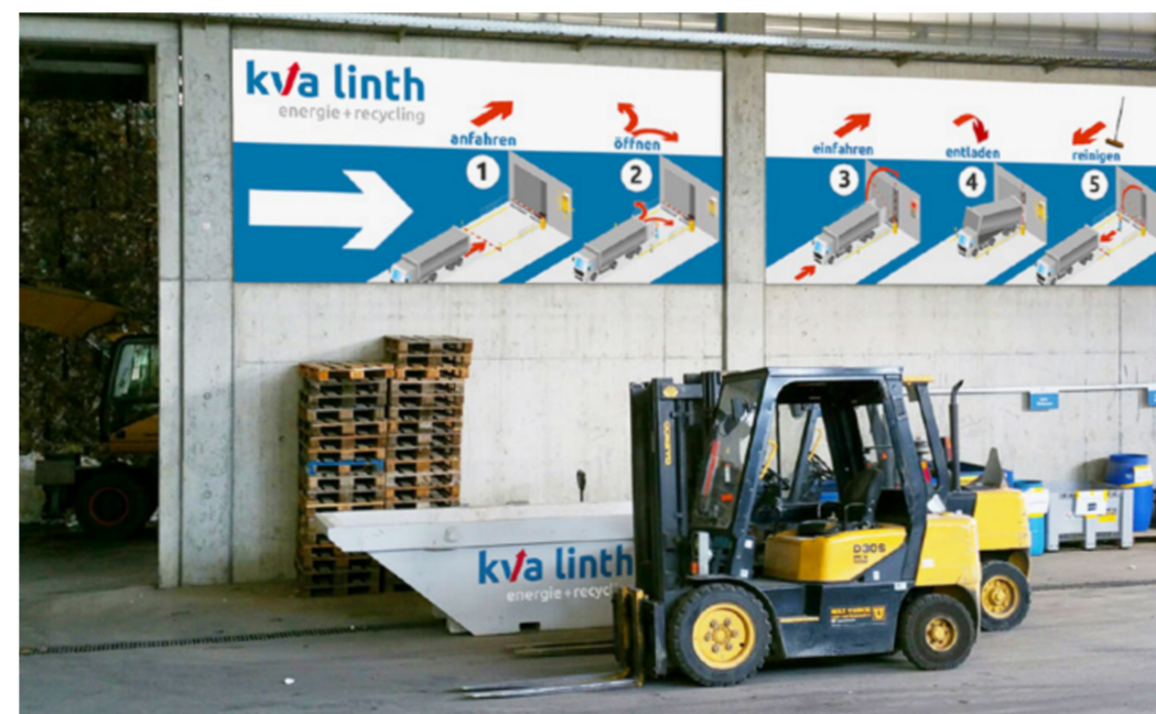
Energie & Recycling: Die KVA Linth hat den Wandel von der einfachen Kehrichtverbrennungsanlage zum modernen thermischen Kraftwerk vollzogen. Das Corporate Design macht diese Entwicklung auf Drucksachen, im Web sowie auf dem ganzen Betriebsareal sichtbar.