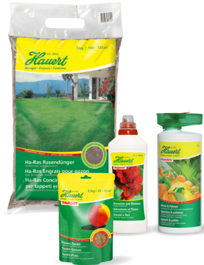
Dünger für den Profi- und den Hausgartenbereich: Leuzinger & Benz hat das bestehende Erscheinungsbild der Firma Hauert aufgefrischt und als Grundlage für Verpackungen, Broschüren und andere Kommunikationsmittel ein Gestaltungsmニュアル entwickelt.

einem Klick Farben und Grössenverhältnisse verändern und neue Schriften ausprobieren. Alle diese Möglichkeiten nützen dem Gestalter aber nur, wenn er sein Handwerk von Grund auf beherrscht und er sich ob der vielen Möglichkeiten nicht in die Irre führen lässt. Unverzichtbar bleibt in jedem Fall eine vertiefte Auseinandersetzung mit der Unternehmung oder dem zu begleitenden Projekt. Ein präzises Agenturbriefing ist dafür zentral.