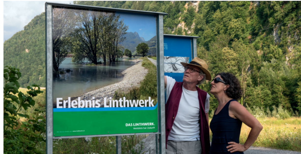
Kommunikation für ein umstrittenes Hochwasserschutzprojekt: Leuzinger & Benz hat das Linthwerk mit einer klaren Positionierung, einem kohärenten Erscheinungsbild sowie einer ganzheitlichen Kommunikationsstrategie zu einer anerkannten und respektierten Institution gemacht.

Sie vereinfachen die Ideenfindung und erweitern das Gestaltungsspektrum. Das hat aber auch seine Tücken. So ermöglicht das Internet zwar eine weltweite Recherche und ist eine Quelle der Inspiration. Man kann aber auch Gefahr laufen, sich darin zu verlieren. Weiter lassen sich heute mit